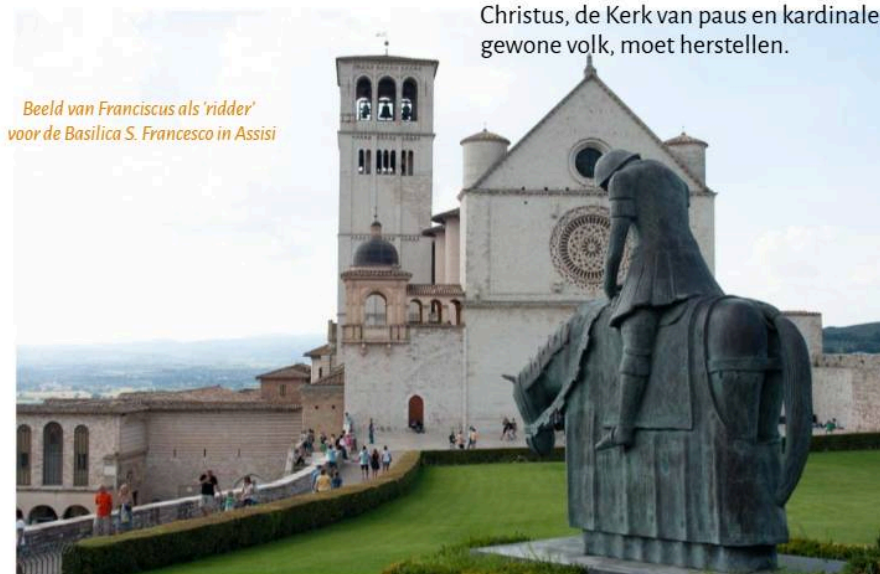
Beeld van Franciscus als 'ridder' voor de Basilica S. Francesco in Assisi

Eenmaal vrij, weet hij het niet meer: moet hij toch maar de winkel overnemen? (Maar is dat alles?) Of toch ridder worden? (Maar die verschrikkelijke oorlog?) Of iets anders...? Dan roept de paus op tot een kruistocht. Franciscus ziet daarin een teken toch ridder te worden. Maar het blijkt een gedachte van hemzelf, niet van God. Want één dagreis verder krijgt hij een droom. Een stem (God?) vraagt: 'Franciscus, wie wil je dienen: de Heer of de knecht?' 'De Heer, natuurlijk!', is het antwoord. 'Waarom volg je dan nu de knecht? Ga terug naar waar je vandaan komt, daar zal je duidelijk worden wat je moet doen.' Franciscus keert terug en er volgt een reeks gebeurtenissen die hem zijn roeping leert verstaan. Hij ontmoet een melaatse. Elke middel-euwer gaat in een wijde boog om hen heen, maar Franciscus omhelst hem en beseft dat waar hij omhoog wilde - ridderschap was adeldom - zijn weg omlaag gaat: hij wordt broeder van de 'minderen', van armen en zieken. Daarna bidt hij om duidelijkheid voor het Kruis van San Damiano en krijgt als antwoord: 'Franciscus, zie je niet dat mijn Huis in verval is? Ga heen en herstel mijn Huis!' Franciscus begint daarop kerkjes te herstellen met gestolen geld van zijn vader. Dit leidt tot een definitieve breuk tussen hen: het begin van Franciscus' religieuze leven. Pas later blijkt dat hij het Huis van Christus, de Kerk van paus en kardinalen én het gewone volk, moet herstellen.